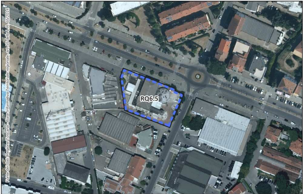
Estratto Ortofoto 2021 – scala 1:2.000