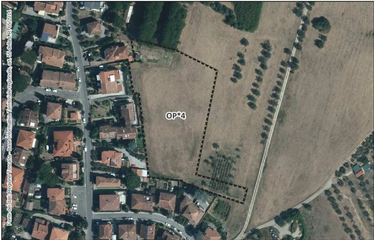
Estratto Ortofoto 2019 – scala 1:2.000