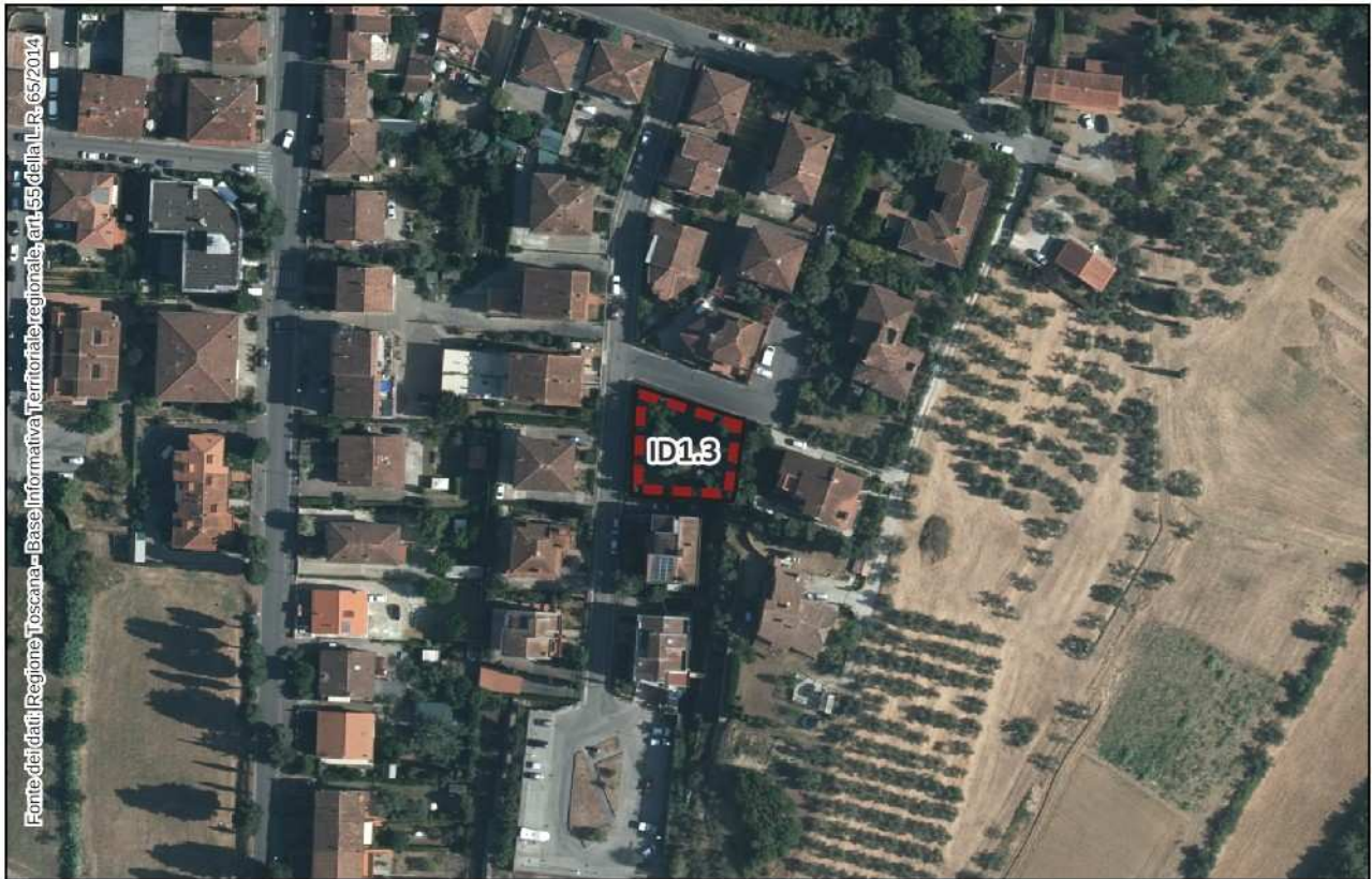
Estratto Ortofoto 2021 – scala 1:2.000