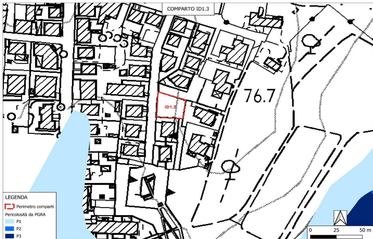
Comparto di trasformazione ID1.3