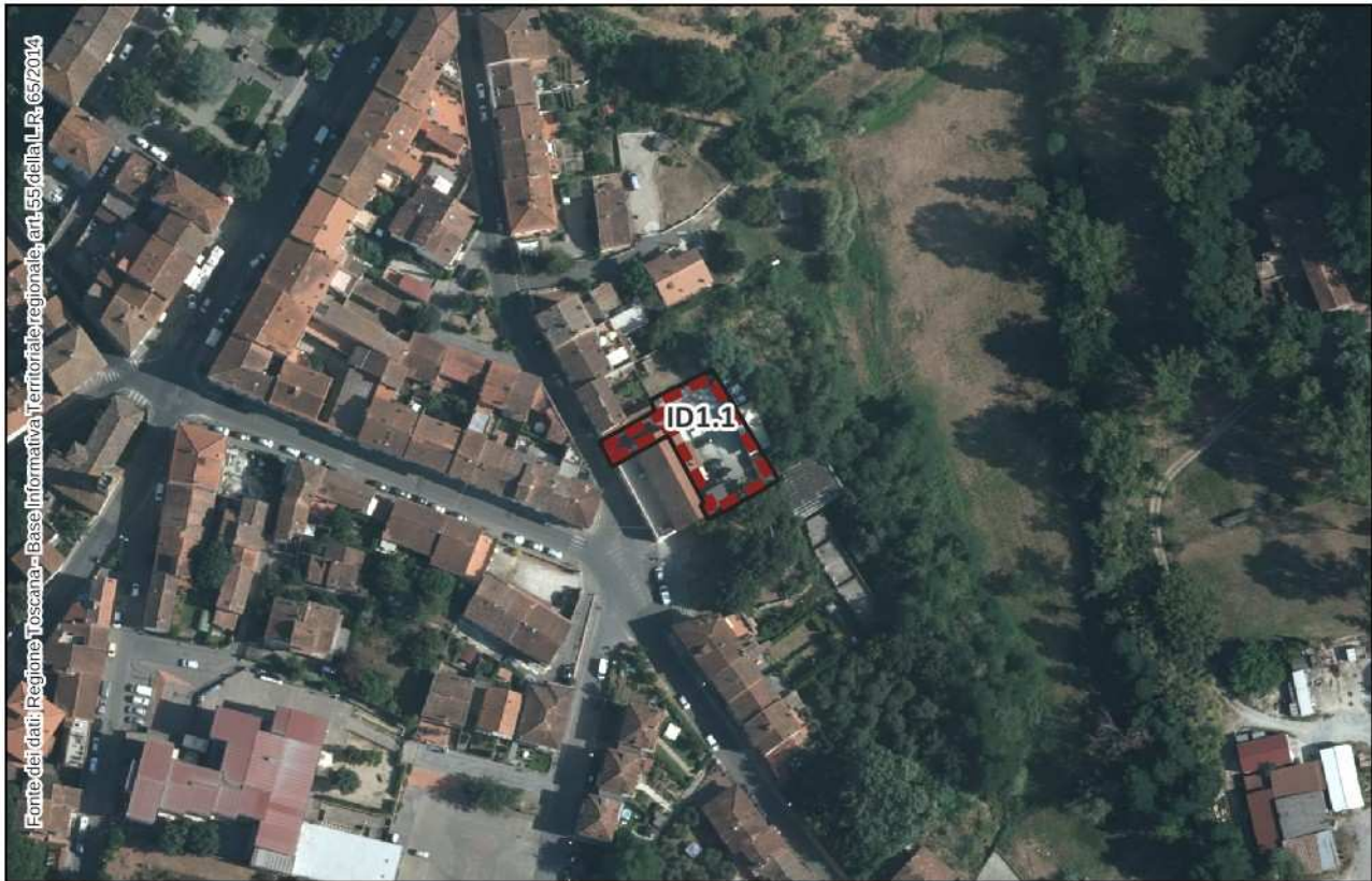
Estratto Ortofoto 2021 – scala 1:2.000